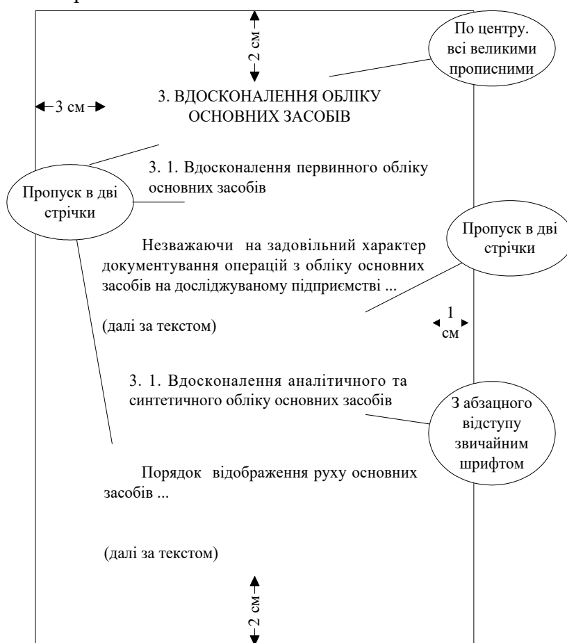
Рис. 4.2. Порядок розміщення тексту курсової роботи на аркуші

Сторінки нумеруються враховуючи титульну сторінку, проте номер сторінки проставляється починаючи з другої сторінки вступу.